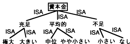
図1 資本金に関する背景知識